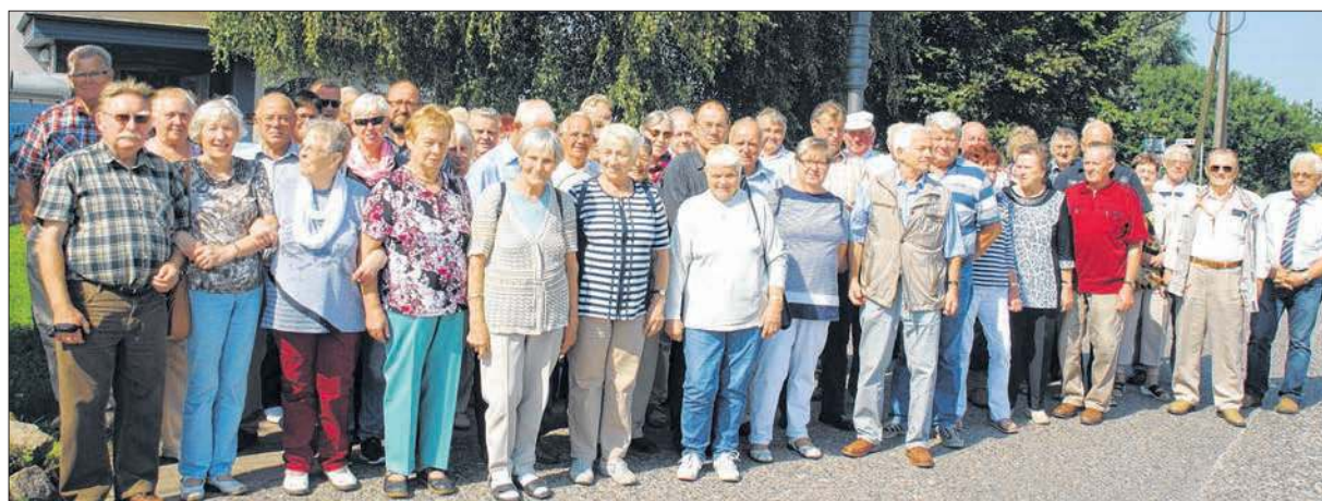
Gruppenfoto vor der Gaststätte „Nautilus“ in Neukamp.

Reisegruppe den Kurzfilm von der letzten Fahrt - sie führte über Bad Doberan auf die Insel Poel nach Wismar – auf der Rückfahrt im Bus an. rp