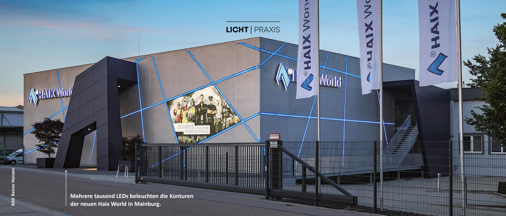
Mehrere tausend LEDs beleuchten die Konturen der neuen Haix World in Mainburg.