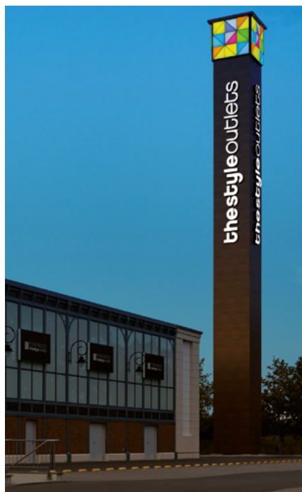
Der 35 Meter hohe Turm macht vor allem in beleuchtetem Zustand auf sich aufmerksam.