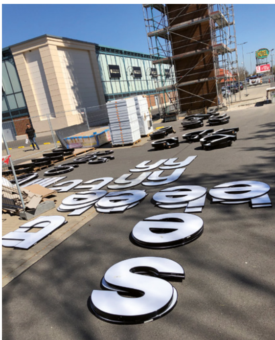
An jeder Seite bekam der Turm einen Schriftzug: Die Buchstaben sind mit insgesamt 470 Abstandsstiften befestigt.