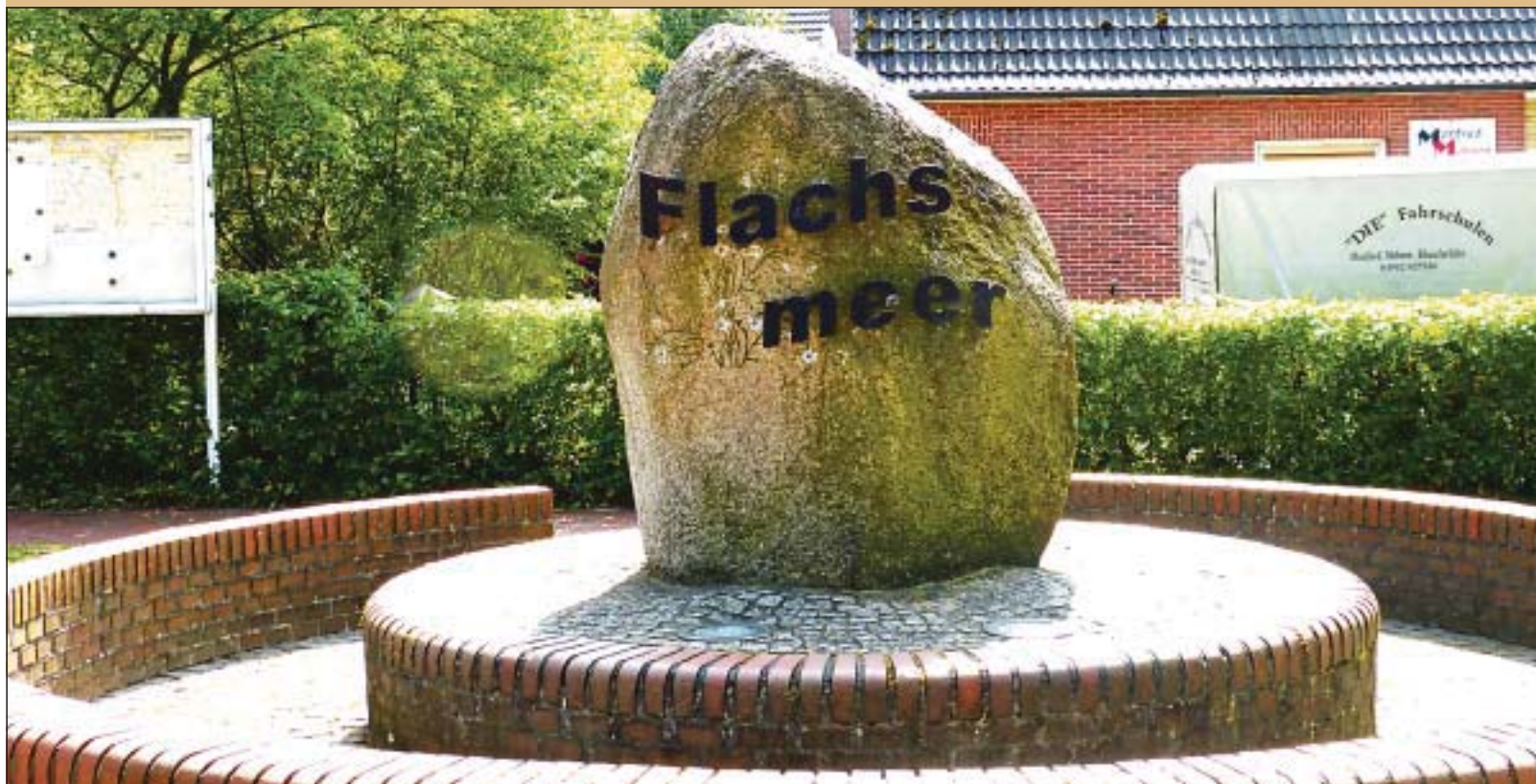
Der Flachsmeer-Stein im Herzen des Ortes.