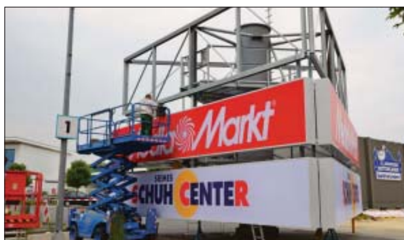
Die Werbetafeln werden am Boden montiert. Später werden die sogenannten Kronen nach oben gehoben.