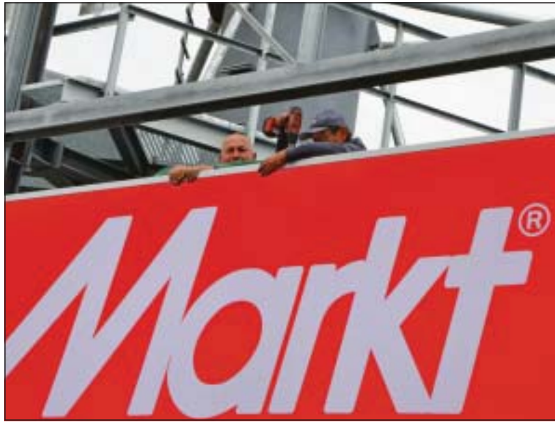
Wie groß die Werbetafeln sind, ist auf diesem Bild gut zu erkennen. Die Arbeiter verschwinden fast dahinter.